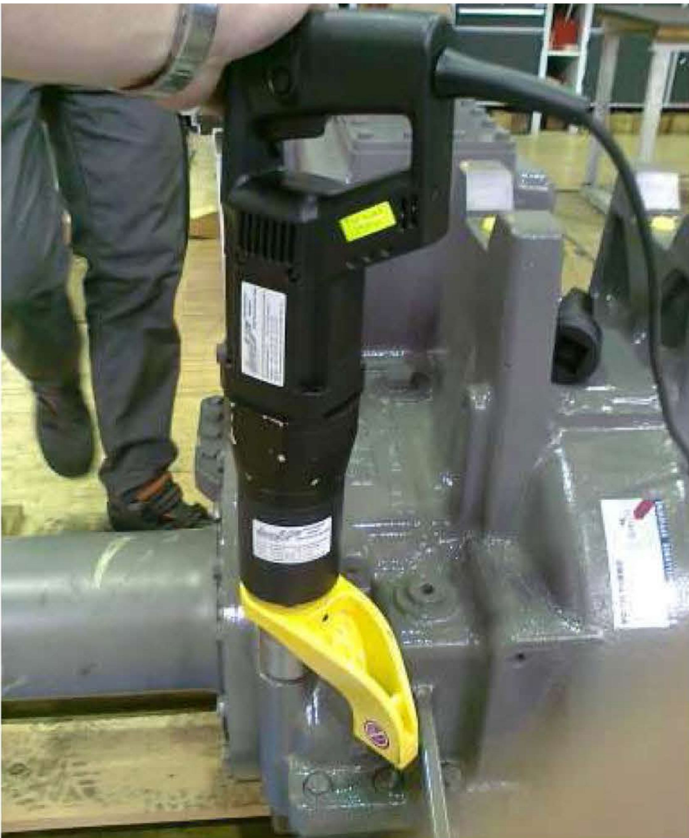
Der ETM – die Extreme Torque Machines bis 8.000 Nm mit 230 V 50 Hz Antrieb für einfachsten Einsatz an jeder Steckdose.

Alle Schraubgeräte sind Drehmomentgenau mit einer nachgewiesenen Minimal-Abweichung nach DIN / ISO von unter 3 % und CE-konform !