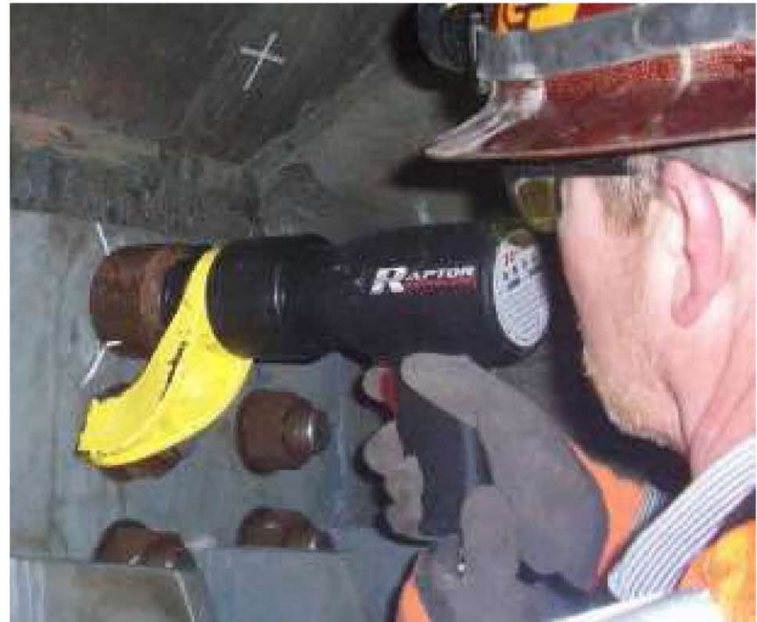
Der RP – Raptor Pneumatik-Drehmomentschrauber bis 8.000 Nm zum Betrieb wie ein Schlagschrauber, aber so genau wie ein Drehmomentschlüssel und viel leiser. Geeignet für Luftnetze mit nur 5,5 bar Fließdruck.